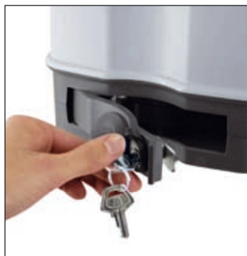
Внутренняя серийная ручная разблокировка. Standard internal manual release device

* Относятся к незащитым створкам. They refer to leaves with openings and not totally closed panels.